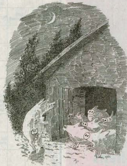
„Wenn ihr Schuß habt vor der Ferkel, geht zurück in euren Stinkstall und laßt euch verurteilen.“