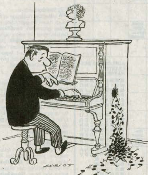
Der Klassiker: Lorient alias Vicco von Bülow versteht es, auch ohne Worte sehr viel sehr pointiert zu sagen.

Telefon: 089/ 24 29 44 33, Internet: www.komische-pinakothek.de